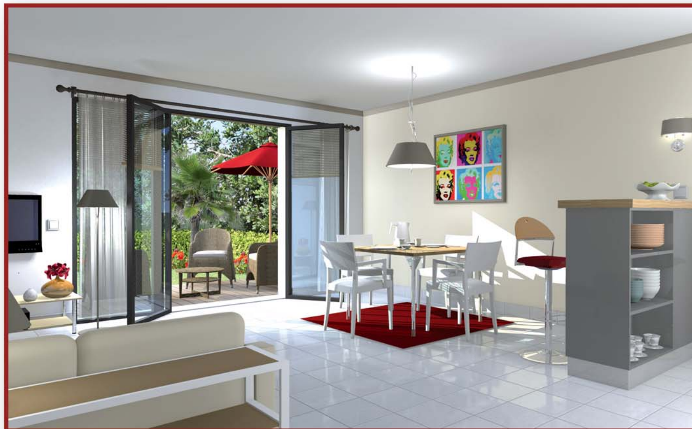
Décoration et aménagement intérieur non contractuels. L'appartement est livré non meublé.

Olonne-sur-Mer offre un cadre de vie exceptionnel entre océan, ville et nature. Station balnéaire dynamique et entreprenante, elle se situe à 5 km du centre des Sables d'Olonne et fait partie intégrante de la Communauté de Communes des Olonnes (50 000 habitants).