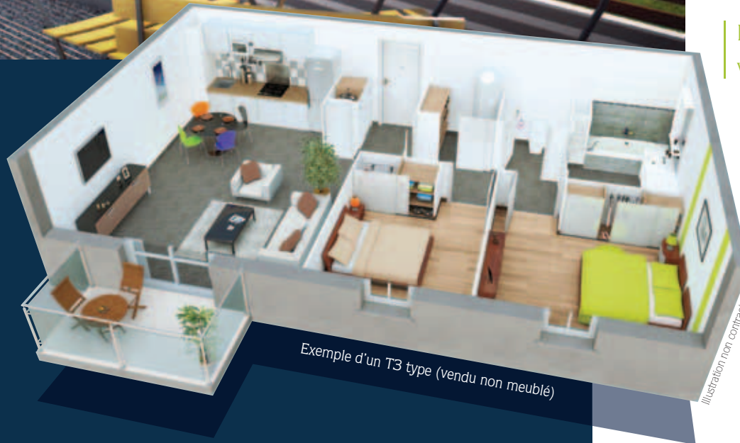
Exemple d'un T3 type (vendu non meublé)